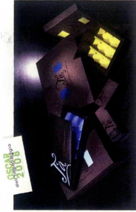
Le confezioni per cioccolatini T'A Sentimento Italiano di Prealpi per i prodotti da regalo e ricorrenza figura tra i premiati per il quality design.

Assegnati il 17 aprile 2008 i premi alle imprese italiane che hanno adottato soluzioni di packaging progettate secondo i criteri del quality design. Valutando l'equilibrio tra dimensioni grafiche, strutturali e funzionali dei packaging in concorso, la giuria ha decretato i vincitori tra 29 imballaggi finalisti. I premi speciali sono andati alla Cartografica Pusterla per la confezione per vini Duca di Salaparuta e due premi speciali ex aequo per la tecnologia sono stati assegnati a Deles Imballaggi per etichette multimateriale e a Granarolo per una confezione del latte.